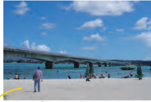
古宇利ブルーに癒される。大川