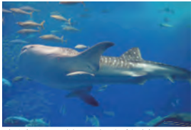
大迫力！ 美ら海水族館のジンベイザメ。

6月18日から2泊3日で、梅雨明け直後の沖縄へ行ってきました。青い空と青い海！セダーメンバーの現実逃避!?! のようすをちょこっとだけご紹介。