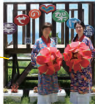
パワースポットで「幸せつかむぞ！」 荒井