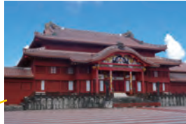
ひとり首里城を満喫。木村