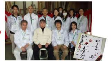
⑤放送終了後に、パチリ。気さくで明るいお人柄に、終始和気あいあいでした。