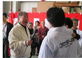
③生放送スタート。ママシさんの毒舌は「この日も絶好調！「ちゃんと杭打てる？」