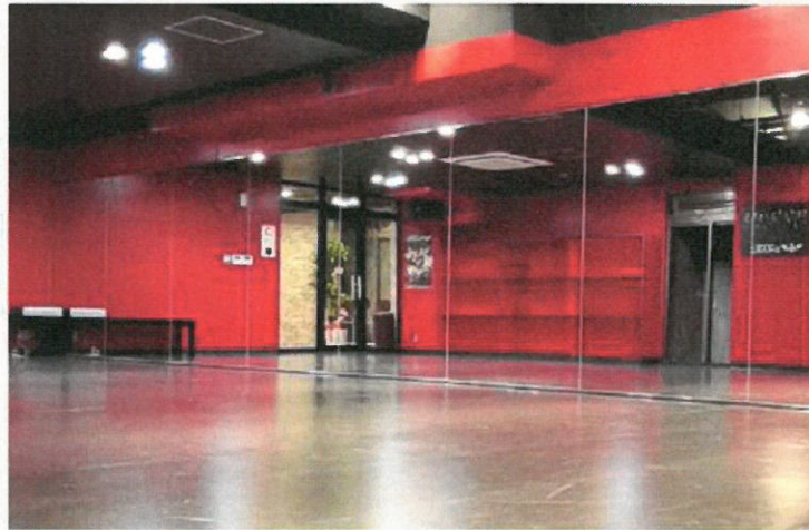
リノリウムの床は、Jazz & Hip-Hopスタジオにピッタリ。