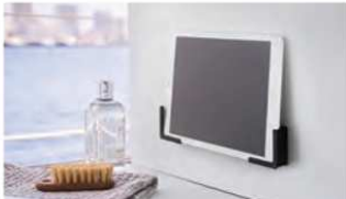
マグネットバスルームタ ブレットホルダー タワー

以前は置き型タイプのホルダーを使っていたのですが、キッチン上をスッキリさせたくて、壁付けタイプに変えました。おかげでマメに掃除するように！ワンアクションがなくなるだけで、やる気が起きる不思議。