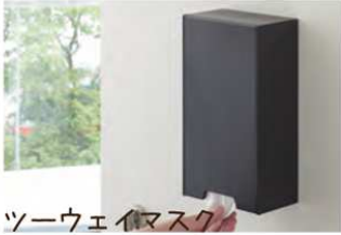
ツウウェイマスク 収納ケースタワー

使い捨てマスクのストック、どこに置いてますか？我が家ではリビング、各自の部屋のクローゼットなど、あちこちさまよったのち、このケースのおかげで玄関ドアの一枚所に落ち着きました。