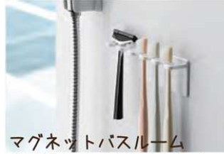
マグネットバスルーム 歯ブラシホルダー5連 ミスト

コレ欲しい！バスタブにつかる時間が長くなる季節。お風呂に入りながら映画観賞してみたい（のぼせ注意です）。お風呂の壁に強力マグネットで簡単取付け。挟んで固定させるからスマホからタブレットまで様々なサイズに対応。