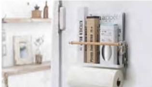
マグネットキッチンペーパー & ラップホルダートスカ

使い捨てマスクのストック、どこに置いてますか？我が家ではリビング、各自の部屋のクローゼットなど、あちこちさまよったのち、このケースのおかげで玄関ドアの一枚所に落ち着きました。