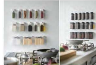
マグネットスパイスボトルタワー

バスルームでは、カミソリや歯ブラシをこんな感じで収納しています。マグネットなので、好きな位置につけられる点が◎。カミソリは子どもの手が届かない位置に。