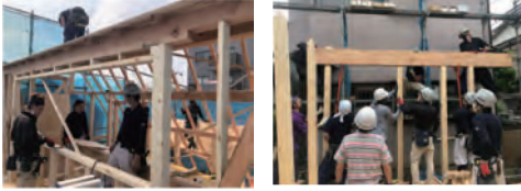
3階奥の屋根も全部張れました。 ひとつの梁に何人も。