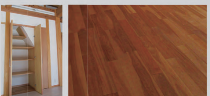
大容量リビング収納。冬は暖かく、夏はサラッと。素足で歩きたい床。作業スペースが広くお手入れしやすい台所。