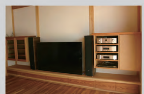
経年変化も楽しみな杉一枚板のAVボード。