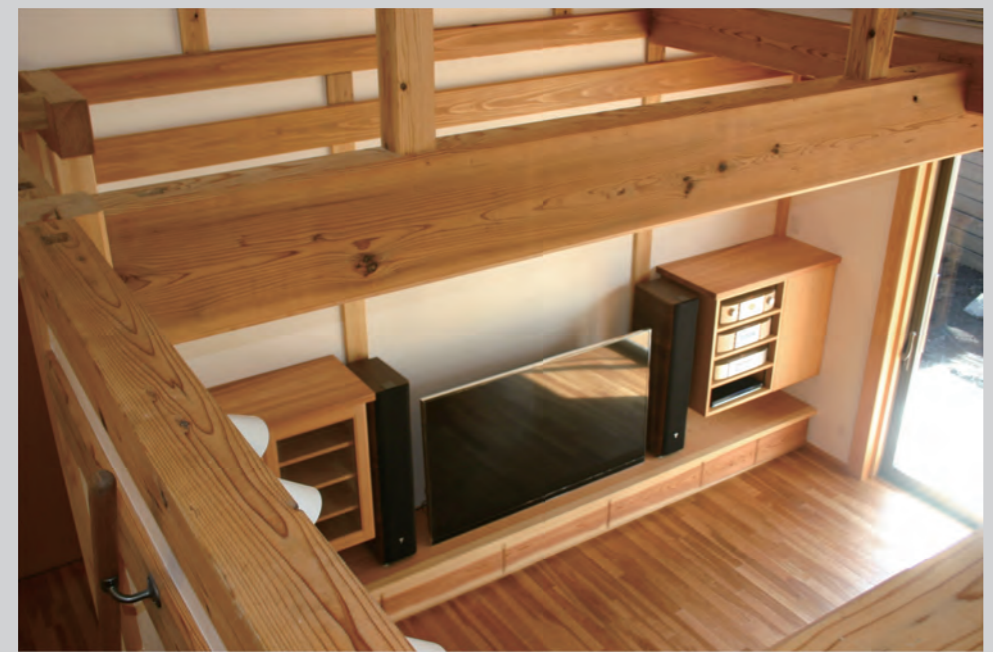
屋根裏から見たリビング。空間の高さを強調することにより、広く感じられます。天窗もあるので、光も風もすみずみまで届いて気持ちイイ!