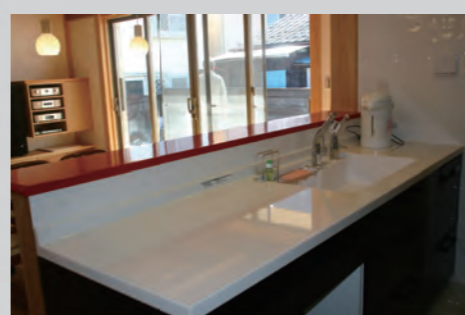
作業スペースが広くお手入れしやすい台所。

【お客様の声】 リビングは天井がなく、さらに天窗があるので開放感があります。南側の掃出し窓も広いので、冬場は奥まで日差しが入り、床暖なしでも暖かいですよ。床はすべて樺桜、壁は漆喰にしたのでとても落ち着きます。音楽をかけても音の響きが良いように感じるんです。各部屋の出入口はすべて引き戸で段差がないので、将来も安心。ロボット掃除機もOK! 収納も多いので片付けがラクで嬉しい!!