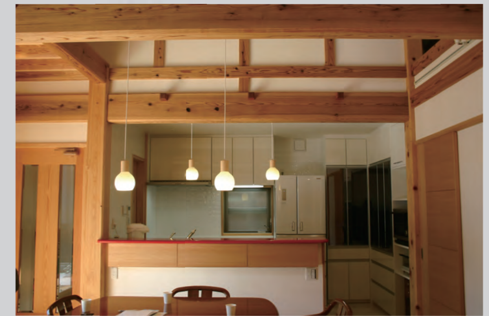
真っ赤なカウンターがアクセントのキッチンスペース。スムーズな家事動線を考えて入り口が2ヶ所あり、収納もたくさんで使いやすい。