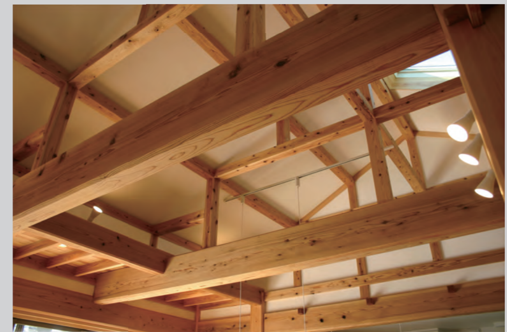
杉材のみごとな梁。梁があると、部屋の中に木がたくさんあるように見えるので、木に囲まれて過ごす癒しを体感できます。毎日森林浴気分!?