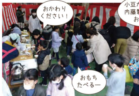
おかわり ください！